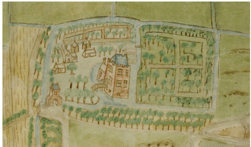
Een impressie van het Huys te Boekhorst in 1587 door Pieter Bruins

iets meer dan 10% van de oppervlakte van de huidige gemeente Noordwijkerhout – ook veel maar zeker niet de eerder genoemde grote uitgestrektheid. Het gegeven uit 1475 dat er 7 morgen (ca. 6 ha) land bij Boekhorst hoorde lijkt anderzijds weer erg weinig en is misschien alleen het land dat direct aan het kasteel lag. Het enige waar we ons verder aan kunnen vasthouden is een kaart van Pieter Bruins uit 1587 van de landen en wildernissen van de Boekhorst onder Noordwijkerhout , waarop ook een aardige impressie van het kasteeltje, compleet met een slotgracht en een poortgebouw. De bijbehorende landerijen vormen een grillig geheel van weiland, teelland en duinen. Schuin tegenover de ingang en oprijlaan (linksonder op de afbeelding) die uitkwam op de Langeveldlerlaan, ligt nu nog een