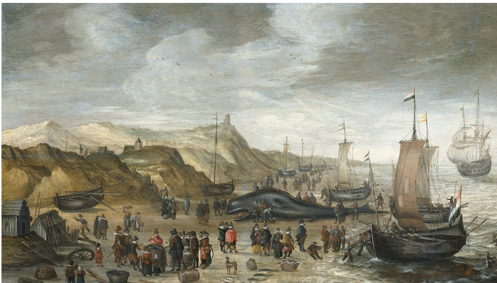
Esaias van de Velde: Een potvis op het strand bij Noordwijk, 28 december 1614 (Rijksmuseum)

Ook al zijn er van deze periode geen doopgegevens uit Leiden of Noordwijk, er kan daarvoor toch wel met vrij grote zekerheid worden gesteld dat zijn kinderen hier in Noordwijk zijn geboren. De eerste maal dat we werkelijk de naam van zijn zoon Andries tegenkomen is in het Hoofdgeld van Noordwijk van 1623, waarin hij met zijn ouders en zes zusjes en broertjes vermeld staat, als eerste van de drie jongens en daarmee waarschijnlijk de oudste.