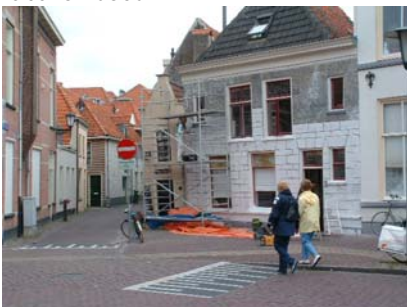
Stadtrundgang in Kampen