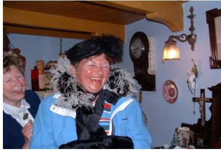
Sie hat sich nicht gestraubt ...