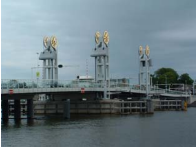
Wer kennt sie nicht, die Kamperbrücke

Es war wieder einmal ein wunderschöner Tag in Kampen. Freitagnachmittag wurden wir alle von der Freiwilligen Feuerwehr von Bovenhaven überrascht: Die Papiere, die wir vom Hafenmeister erhaltenen hatten, war ein Coupon für einen Gratiskaffee in der Kantine. Das ließ sich der Club nicht entgehen. Auch war man in Bovenhaven so erfreut, daß unser Club sich dort eingefunden hatten, daß später noch ein "Borrelhapje" (Umtrunk mit Häppchen) serviert wurde. Auch für das neueste Mitglied, die Sea Rover , haben wir alle ein Gläschen geleert. Alle Schiffe sahen prächtig aus: Blankpoliert und geputzt. Und bis in die späten Stunden wurde viel gefachsimpelt.