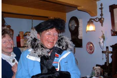
Dat dit niet echt tegen haar zin ging.....