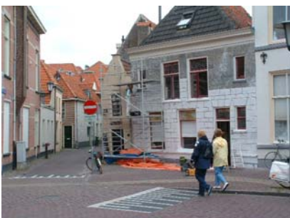
de stadswandeling Kampen