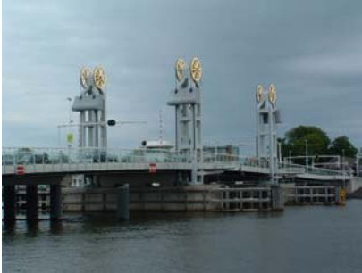
Wie kent hem niet, de Kamperbrug

Het was weer een super mooie dag in Kampen. Op vrijdagmiddag werden wij al verrast door de vrijwilligers van de Bovenhaven. In de door ons ontvangen papieren, van de havenmeester, zat een coupon voor een gratis kopje koffie in de kantine. Hier heeft de club gebruik van gemaakt. Men vond het in de Bovenhaven zo bijzonder dat onze club daar was neer gestreken dat er later een borrelhapje werd geserveerd. Ook hebben we met de hele groep de nieuwste aanwinst, Sea Rover, "ingedronken". Alle schepen zagen er prachtig uit. Er is veel gepoetst. Tot in de late uurtjes is er veel wat "overleg" geweest.