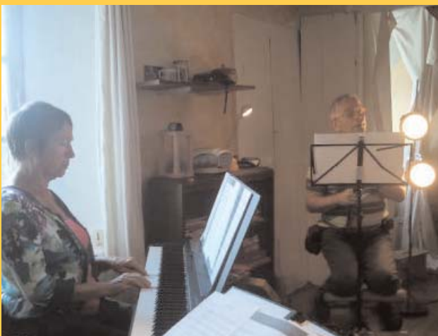
muziek in de werkweek

We willen proberen elkaar te inspireren door het aanbieden van diverse kunstvormen. Maar ook een wandeling naar de Doux, het elkaar voorlezen van literatuur en (eigen) poëzie of samen muziek maken is mogelijk. Neem vooral je muziekinstrumenten en liedboeken mee! Er zal zoveel mogelijk biologisch en met lokale ingrediënten gekookt worden.