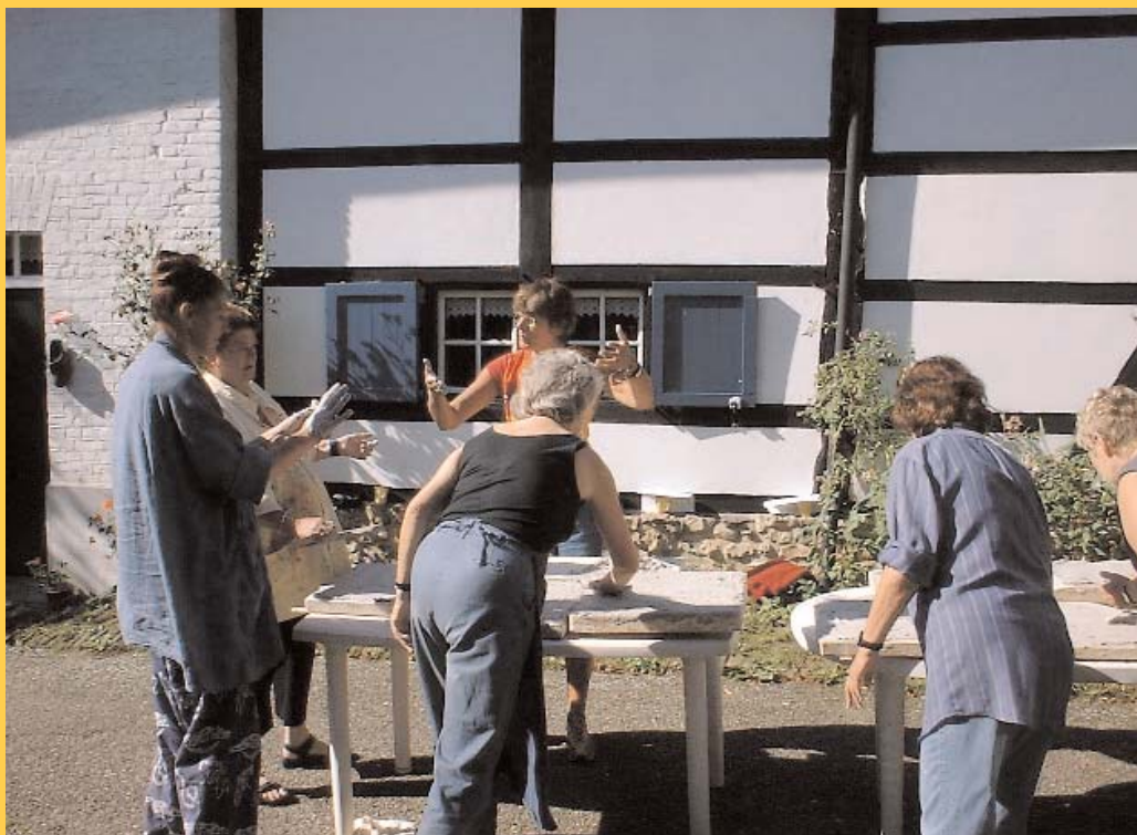
weekendgroep in Camerig