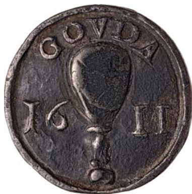
leprozenpenning Gouda (2x ware grootte)

Van de stad Gouda bestaan enkelzijdige loodjes met daarop het jaartal 1611. Het jaartal wordt gescheiden door een lazarusklep met daarboven de tekst GOVDA. Dit loodje, met een diameter van 25 mm, staat beschreven in Bijdragen voor de Penningkunde (Niet in den handel) van het Friesch Genootschap uit 1841. 1 Een exemplaar van de penning bevindt zich samen met twee houten lazaruskleppers uit 1787 in de collectie van Museum Gouda. 2 De penning werd uitgedeeld door de lazarusmeesters en gaf toegang tot het leproshuis. De Goudse leprozen mochten ook collecteren langs de belangrijke vaarroutes die langs Gouda liepen. Er werd aan de schippers een bedrag gevraagd voor de leprozen. Volgens de Goudse keurboeken werd in 1652 de laatste leproos opgenomen.