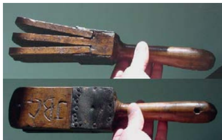
Lazarusklepper met ingebouwde bedelnap

In 1586 bracht Prins Maurits met een speciale ‘orde op het schouwen en bedelen der leprozen’ de nodige eenheid aan in de verscheidenheid van stedelijke verordeningen. Lepralijders uit de gehele noordelijke Nederlanden moesten zich vanaf dat jaar in Haarlem laten onderzoeken. Alle stadsbesturen in Holland of