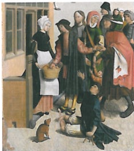
Brooduitdeling (detail), Meester van Alkmaar, 1504