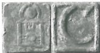
Leiden, armenpenning met C, z.j. (NUMIS 1037167)

De letter 'P' wordt nogal eens voor 'penning' versleten, maar zal in de meeste gevallen, zoals bij Woerden en Amsterdam