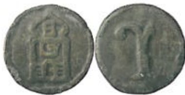
Leiden, armenpenning met r, z.j. (NUMIS 1037168)

pond hebben betekend. Andere letterbetekenissen zouden kunnen zijn D voor diaconie, L voor Luthers, W voor wijk en RB voor roggebrood.