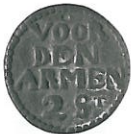
Van Orden Pl. XVIII 6