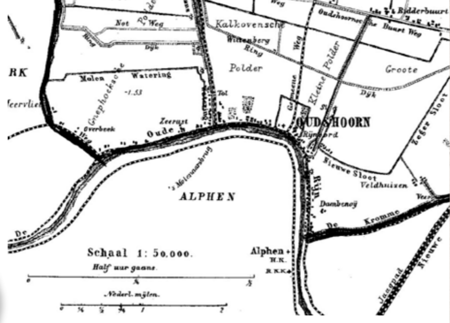
Afb. 21 Tol bij Oudshoorn