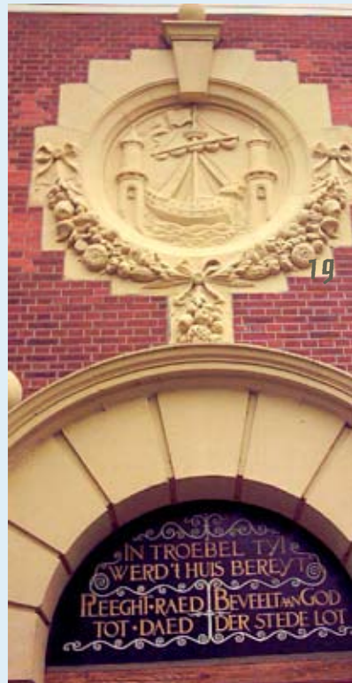
Afb. 12 Gevelsteen in Muiden.