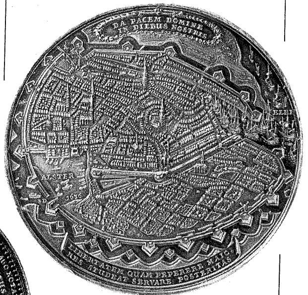
Sebastian Dadler, 1636 (137g, 79mm); Museum für Hamburgische Geschichte