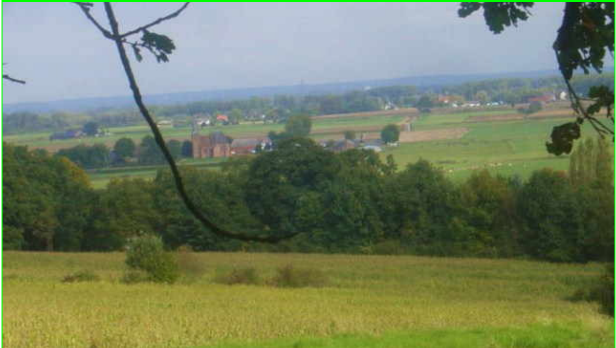
Panorama vanaf de stuwwal op de Ooijpolder en kerkje van Persingen