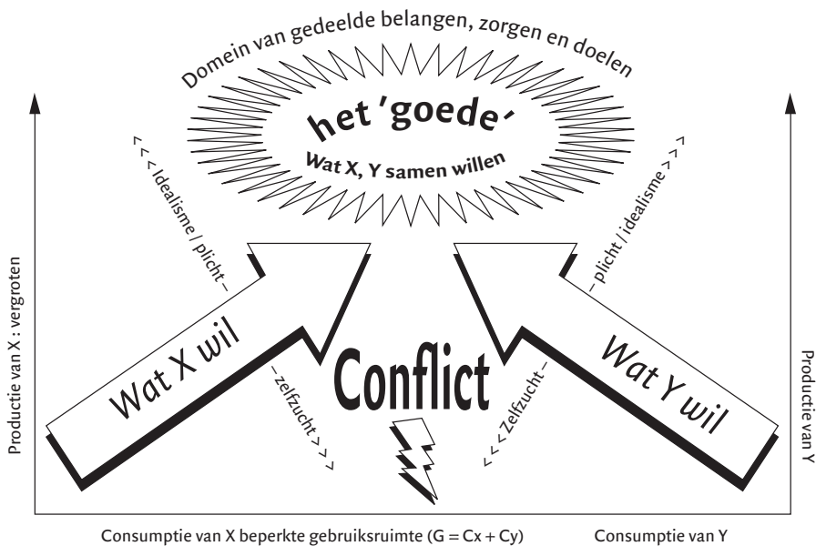
Figuur 1. X en Y als concurrenten en bondgenoten gebruiken morele taal om hun onderlinge samenwerking op te krikken.

Uiteraard zijn complexe samenwerkingsverbanden zelden zo transparant als deze figuur suggereert. Morele termen worden voortdurend vaag en suggestief gebruikt. Leiders zullen voortdurend meer braafheid in de burgers stimuleren dan zij zelf feitelijk belichamen. Zij zullen voortdurend zaken als goed aanprijzen die zeker in het belang zijn van bepaalde groepen en zichzelf, maar daarmee niet noodzakelijk in het algemeen belang.