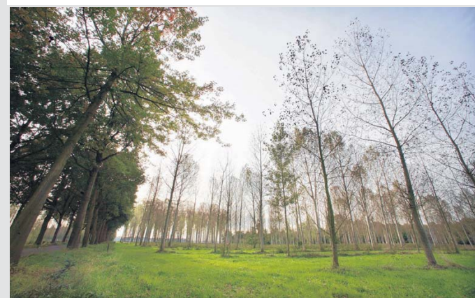
Het Limbrichterbos staat centraal in de visie van de acht belangenorganisaties.

zou de groene structuur langs de Ruitersdijk, Tomberstraat en Beelaertsstraat vanaf Illikhoven tot aan het Julianakanaal completeren.