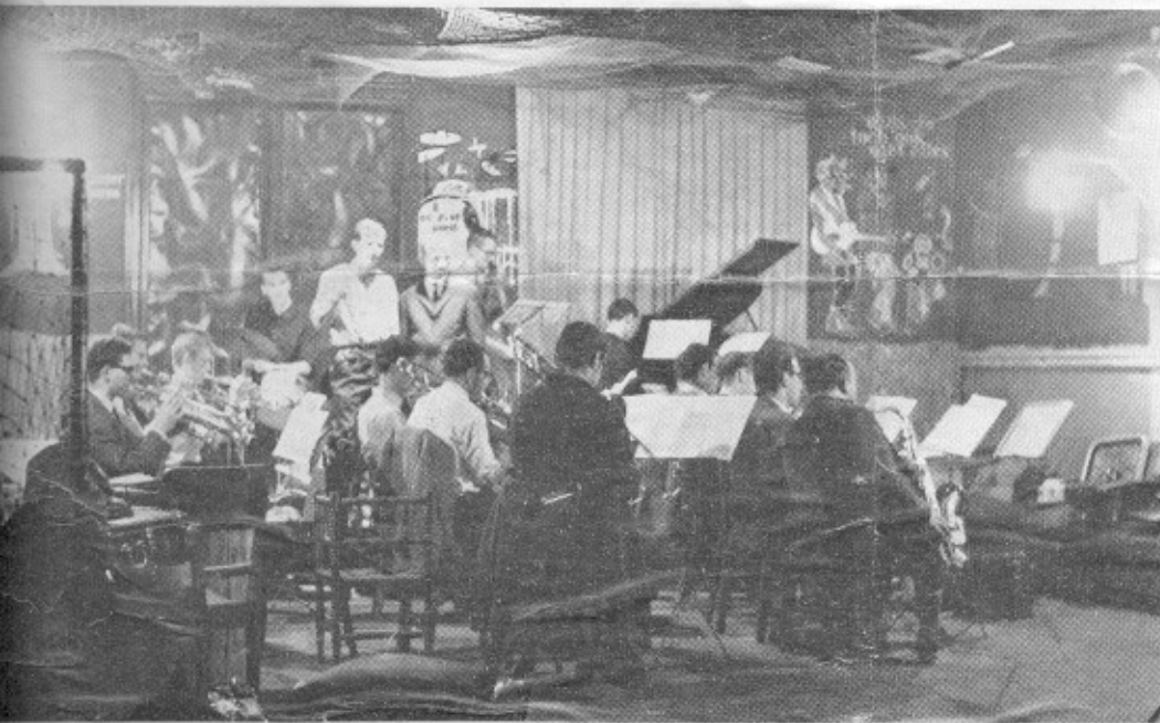
Iedere zaterdagmiddag wordt er door de musici ijverig gerepeteerd . . .

In Haarlem, de keurige hoofdstad van Noord-Holland, die de toerist o.a. het Frans Halsmuseum, de St. Bavo en een ieder jaar wisselende groep bloemenmeisjes gunt, staat aan het Stationsplein ook de Sociëteit „Ekeostos”, ofwel, blijkens een aantal opschriften, „De voormalige puberclub De Slof”. Trein- en busreizigers, en andere voorbijgangers zullen meestal de gecalligrafeerde opwekking om hier naar binnen te gaan, negeren en waarom ook niet, de inrichting onderscheidt zich in bijna niets van zoveel andere: visnetten, opschriften vol zelfspot, kaarsen in bedruipde flessen en een zichtbaar gebrek aan produkten van de gloeilampindustrie.