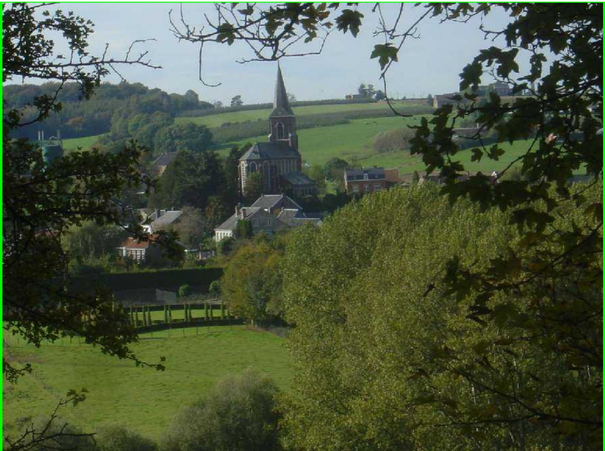
Zicht op Teuven