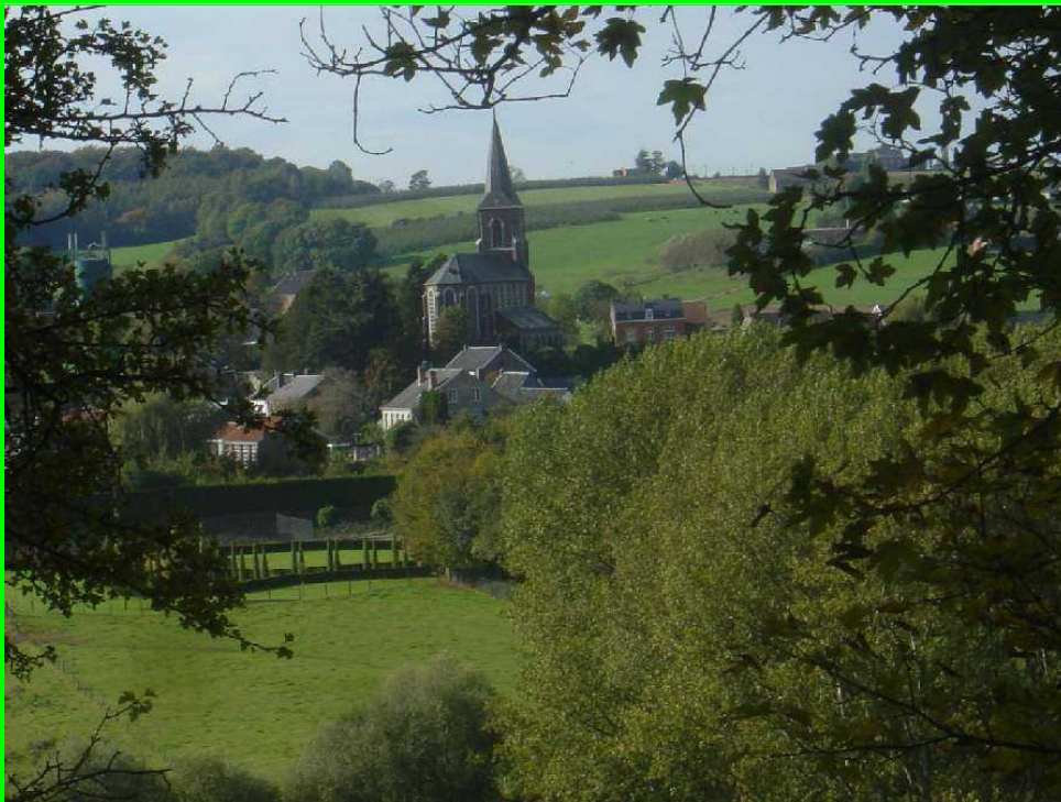
Zicht op Teuven