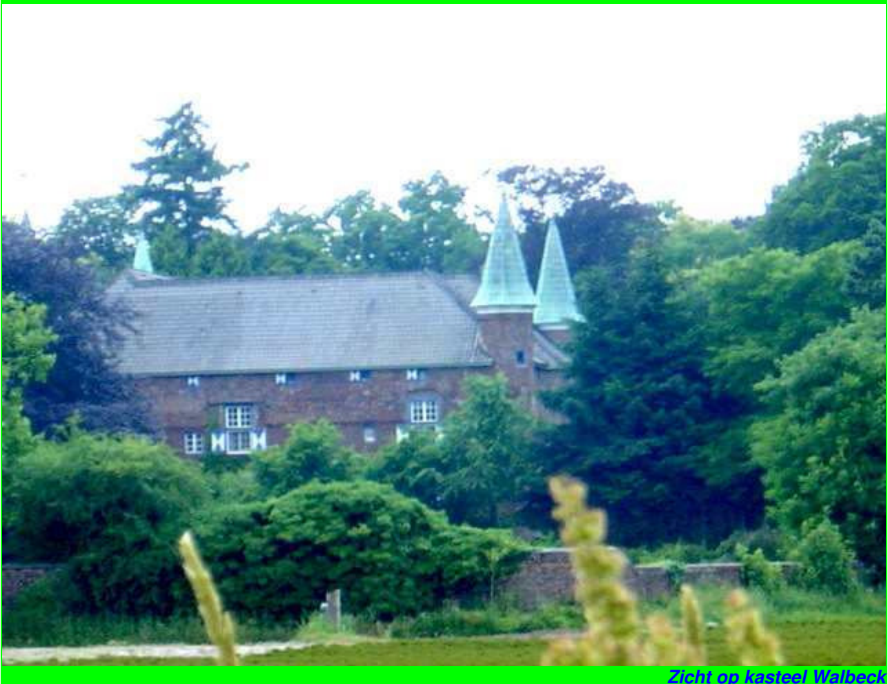
Zicht op kasteel Walbeck

Een typisch grensgeval: Tussen Arcen, Steprath en Walbeck