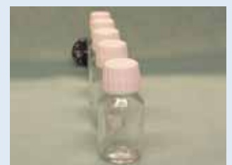
Vooraanzicht van het linkeroog. Alleen het zwarte balletje is half zichtbaar.