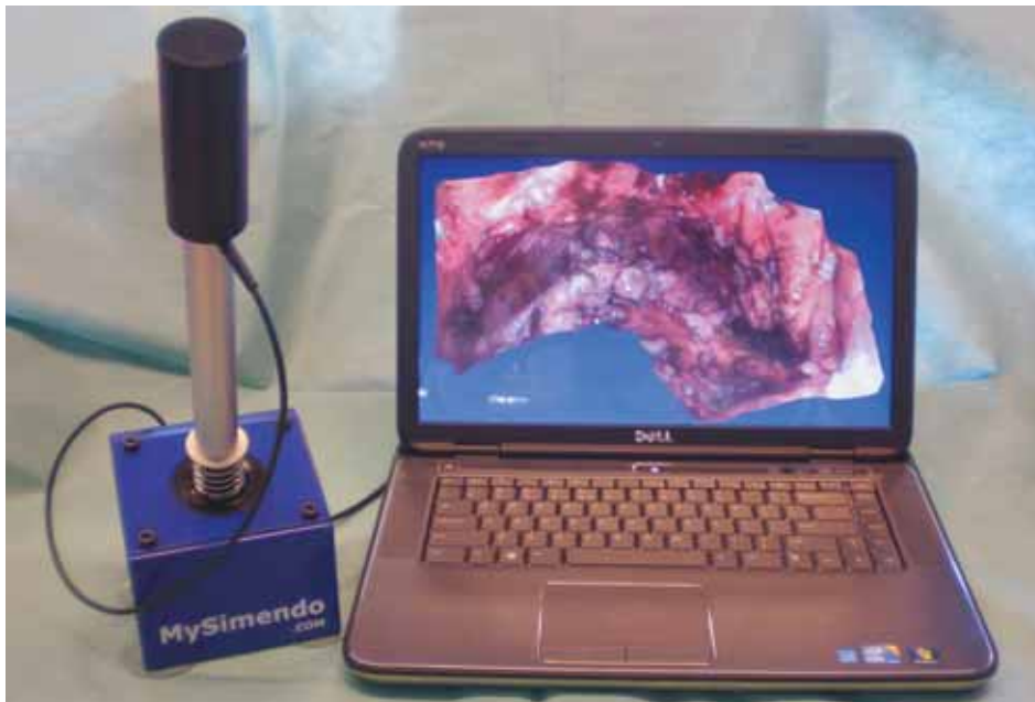
8. Endoscopische cameratrainer van Simendo gekoppeld aan TNO-laptop met 3D-model van het kleine bekken (hier na verwijdering van de prostaat). Door de joystick te bewegen zoals een camera, kun je navigeren alsof je via de endoscoop in een echte patiënt rondkijkt. De beelden kunnen naar keuze op een gewone of een 3D-monitor worden bekeken.

en buiten de OK aanwezig zal zijn. 3D-beelden zijn zeker niet exclusief verbonden aan robotchirurgie. Ook andere modaliteiten kunnen 3D-beelden leveren, zoals OK-microscopen, ultrasound, röntgen en MRI. Voor ziekenhuizen met plannen voor nieuwbouw of verbouwingen is het daarom zinvol om netwerken en archiveringssystemen zodanig in te richten dat deze voorbereid zijn op de grotere informatiestroom die 3D-beeldtechniek met zich meebrengt. Een eerste concrete toepassing van de 3D-reconstructietechniek lijkt te liggen bij endotrainers voor skillslabs (foto 8). Deze bieden geheel nieuwe opleidingsmogelijkheden en zouden de leercurve voor oriëntatie binnen het lichaam enorm kunnen versnellen. Inzet van 3D-visualisatie heeft aantoonbare meerwaarde bij anatomische educatie. 8 Door de visualisatie, zoals hier, ook nog eens interactief te maken, neemt deze meerwaarde nog verder toe. Er is een enorm