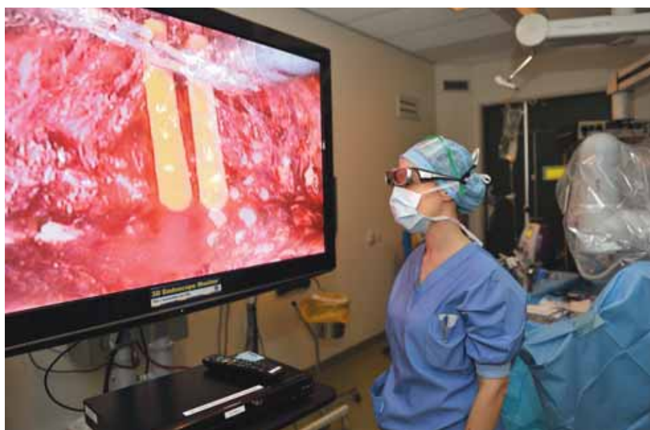
1. Analoge 3D-meekijkmonitor met 3D-dvd-recorder in het Canisius-Wilhelmina Ziekenhuis te Nijmegen. Deze foto is niet door een 3D-bril gemaakt en toont daarom linker- en rechterbeeld door elkaar.

kaar deels afdekken) en de beweging van de camera ten opzichte van andere objecten. Daarnaast geven ook schaduwen en verlichtingsintensiteit diepte-infor-