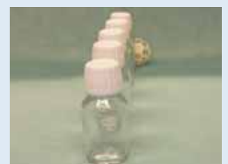
Vooraanzicht van het rechteroog. Nu is alleen het witte balletje half zichtbaar.