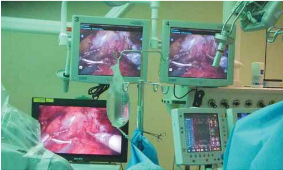
2. Digitale 3D-meekijkmonitor (linksonder) in het Jeroen Bosch Ziekenhuis te Den Bosch, met daarboven linker- en rechterbeeld apart. Deze foto is door één glas van een 3D-bril genomen, waardoor een (enkelvoudig) scherp beeld te zien is. Zie foto 3 voor een stereofoto van deze 3D-monitor.

matie. De wens voor optimaal diepte-zicht bij endoscopie bleef echter op de achtergrond aanwezig.