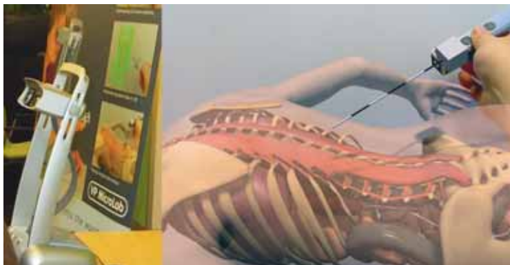
6. Het Microlab-werkstation van Virtual Proteins (links) werkt net als een microscoop, alleen toont het een virtuele werkelijkheid, waarmee allerlei interacties mogelijk zijn. Rechts een voorbeeld van een 3D-model.